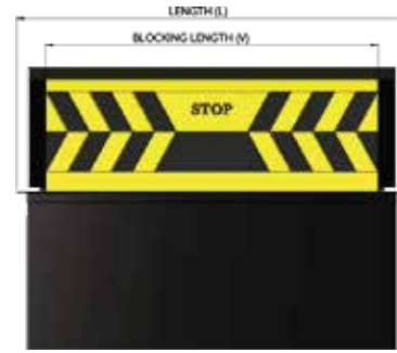
نموذج رؤية امامية Model Front View