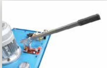
وحدة هيدروليكية و مضخة يدوية