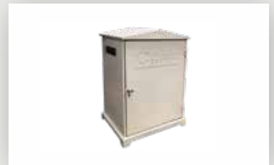
صندوق حديدي لوحدة الطاقة