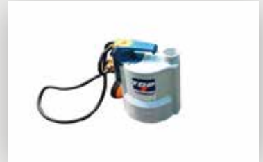
مضخة المياه Water pump