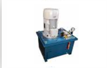
وحدة الطاقة الاساسية وحدة الهيدروليك انتاج عالي High output Power pack