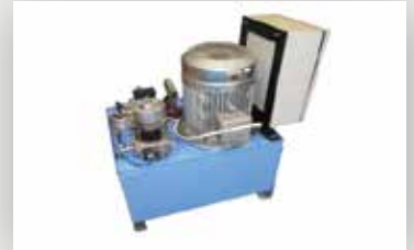
محرك DC اختياري للطوارئ