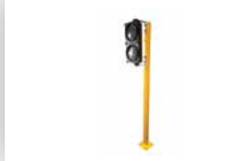
اشارة مرور ضوئية Traffic light