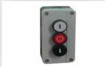
زر ضغط التحكم